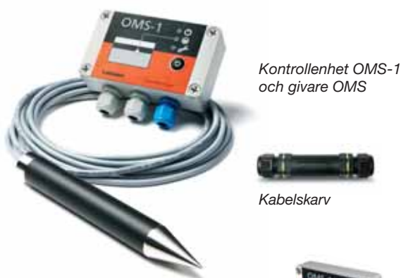
Kontrollenhet OMS-1 och givare OMS

Larmanordning OMS-1 är särskilt utformad för oljeavskiljare. Den anger när oljeavskiljaren bör tömmas och förhindrar därmed skadliga kolväteutsläpp i avloppssystemet.